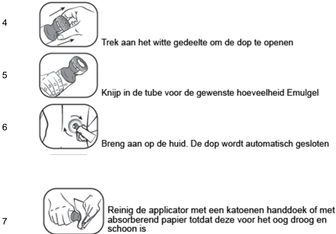
Figuur 2: Doseer- en smeerdop instructie stap 4 t/m 7

Gebruik de applicator niet opnieuw voor een andere tube. Volg bij het weggooien van de tube de in uw land geldende regels voor het weggooien van medicijnen.